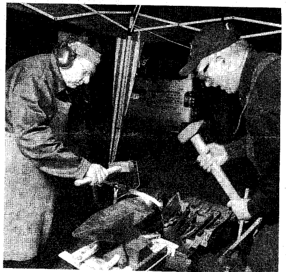
Die Schmiede auf dem Kaiserplatz schützten sich mit Zelten vor dem Einfluss der nass-kalten Witterung.